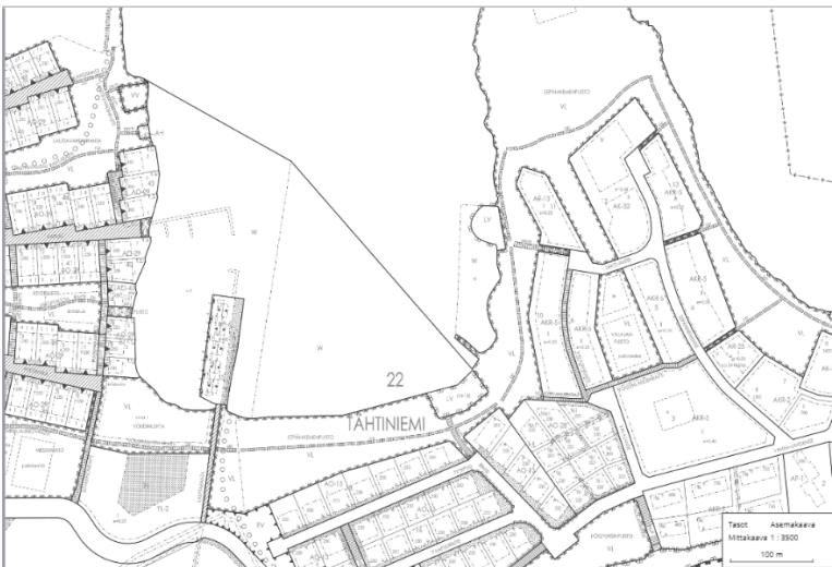
Kuva 1. Tähtiniemen asemakaavaote.

Hulevesialtailla voidaan hallita kasvavaa huleveden määrää sekä puhdistaa hulevesiä ennen niiden pääsyä vesistöön ja näin vähentää voudinlahteen päätyvän kuormituksen määrä kokonaisvaltaisesti. Alueella syntyvät hulevedet ovat tavallisia asutusalueen sekä teollisuusalueen hulevesiä. Niissä esiintyvät haitta-aineet ovat pääasiallisesti raskasmetalleja, pakokaasun jäämiä, kohonneita typpi- sekä fosforipitoisuuksia sekä orgaanista ainesta ja roskia. Rakennetut altaat sijoittuisivat sepänniemen puistoalueelle. Porrastetuiden altaiden väliin asetetaan virtaamaa hidastavat patorakennetta muistuttavat esteet, jotka sisältävät biohiiltä mikä puhdistaa tehokkaasti etenkin raskasmetalleja sekä kiintoainetta. Hidastamalla altaiden välistä virtaamaa voidaan altaissa hyödyntää myös laskeutusaltaiden ominaisuuksia.