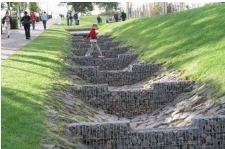
Porrastettu ja kivetty imeytyspainanne