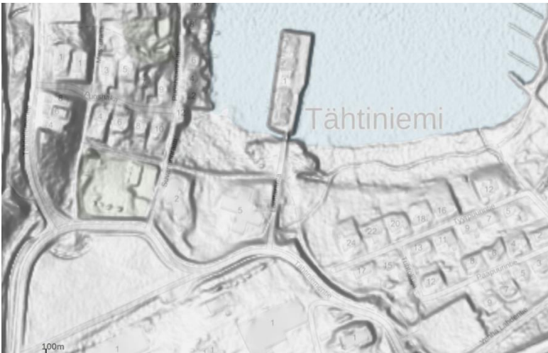
Kuva 6. Tähtiniemen varjostettukorkeusmalli

Porrastettujen laskeutusaltaiden optimaalinen kaltevuus tulee olla enintään 10–15 %. Liian suuri kaltevuus ei hidasta huleveden virtaamaa, jolloin altaiden puhdistavat vaikutukset jäävät vähäisiksi. Liian suuri kaltevuus lisää myös eroosion riskiä. Suunnittelualueen varjostetusta korkeusmallista (kuva 6) nähdään että alueen luonnollinen maanmuoto on loiva Voudinlahtea kohti laskeva rinne, joka ohjaa hulevettä luonnostaan kohti vesistöä. Optimaalisen kaltevuuden määrittäminen hulevesialueille suunnittelualueella vaatii tarkempaa tutkimusta rakennussuunnitelman yhteydessä. Maankamara-karttapalvelusta saadun tiedon mukaan alueen maanpinnan paksuus on noin 15 metriä ja maaperä sisältää hiekkaa sekä soraa. Suunnittelualue ei sijaitse pohjavesialueella.