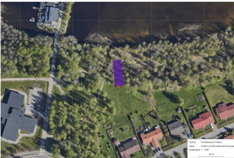
Kuva 4. Altaiden sijoittuminen sepänniemenpuiston alueelle.

Porrastetuilla hulevesialtailla voidaan puhdistaa haitta-aineita alueen hulevesistä sekä hallita niiden virtamaa ennen vesien johtamista voutinlahteen. Hulevesialtaat sijoittuisivat sepänniemen puiston vasempaan reunaan Lauttarannan kadun viereen (kuva 4). Hulevesialtaat asettuisivat perätysten pitkittäissuunnassa 3 eri korkeuteen ja altaiden väliin asetetaan biohiiltä, suodatinhiekkää sekä luonnonkiveä sisältävät esteet, joiden läpi vesivirtaa seuraavaan altaaseen (kuva 5). Keskimmäisen altaan yli rakennetaan kaarisilta, jolloin puiston kulkuyhteydet pysyvät monipuolisina. Altaiden ympäristä koristellaan kasvillisuudella sekä esimerkiksi Heinolan junasillan kanssa yhteensopivalla valaistuksella, joka voidaan sijoittaa altaiden pohjaan tai sillan reunoille maahan. Näin hulevesialtaat palvelevat myös esteettisenä ja virkistävänä elementtinä osana puistoa.