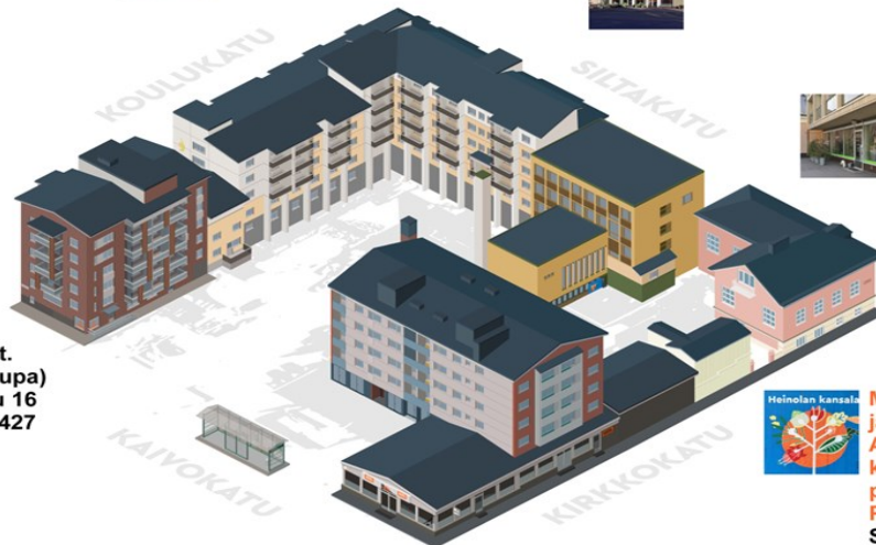
Syrjälän sali Siltakatu 11