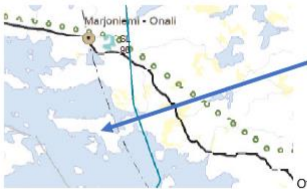
Ote Päijät-Hämeen maakuntakaavasta

Maakuntakaavassa ei ole merkintöjä taikka määräyksiä suunnittelualueelle.