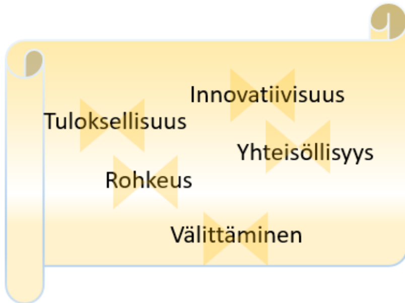
Kuvio 1. Heinolan strategian arvopohja

Heinolan kaupungin arvoiksi on valittu innovatiivisuus, rohkeus, tuloksellisuus, välittäminen ja yhteisöllisyys . Kuviossa 1 esitetyt varhaiskasvatukselle tärkeät arvot on avattu niillä asioilla, jotka on nousseet Heinolan esiopetussuunnitelmasta ja lapsille, huoltajille ja henkilöstölle suunnatusta kyselystä. Kyselyn tuloksena vahvasti esiintynyt osallisuus lisättiin esiopetuksen ja varhaiskasvatuksen arvoihin.