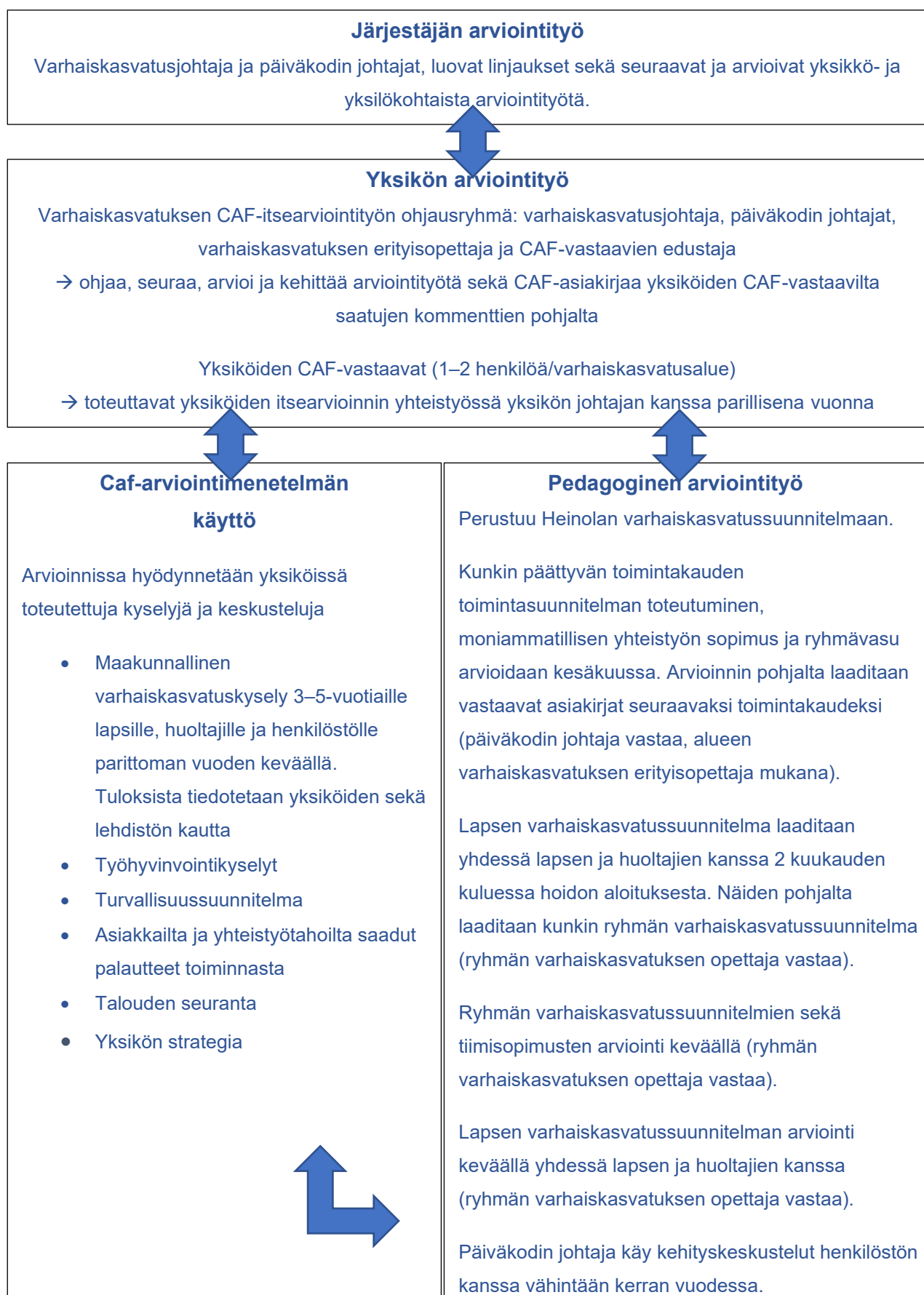
Kuvio 5. Arviointityö Heinolassa