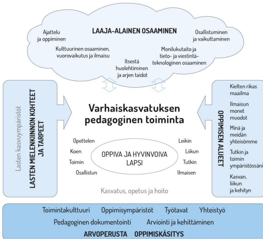
Kuvio 3. Varhaiskasvatuksen pedagogisen toiminnan viitekehys

Tavoitteellisen toiminnan perustan luovat arvoperusta (luku 2.4), oppimiskäsitys (luku 2.5), niihin pohjautuva toimintakulttuuri (luku 3) sekä monipuoliset oppimisympäristöt (luku 3.2), yhteistyö (luku 3.3) ja työtavat (luku 4.3). Lasten mielenkiinnon kohteet ja tarpeet sekä heidän kasvuympäristöönsä liittyvät merkitykselliset asiat ovat toiminnan suunnittelun lähtökohtana. Lähtökohtana ovat myös luvussa 4.5 kuvatut oppimisen alueet. Laadukkaana pedagogisen toiminnan edellytyksenä on suunnitelmallinen dokumentointi, arviointi ja kehittäminen (luvut 4.2 ja 7). Laaja-alaisen osaamisen tavoitteet ohjaavat osaltaan toiminnan suunnittelua (luku 2.7).