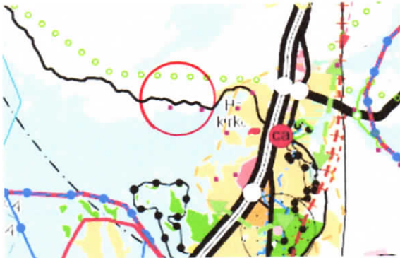
Ote maakuntakaavasta 2014

Alue kuuluu 2.12.2016 hyväksytyyn maakuntakaavaan 2014, joka on tullut lainvoimaiseksi 14.5.2019. Maakuntakaavassa suunnittelualueella on muinaisjäännös, Asuinpaikka mutta ei muita merkintöjä taikka määräyksiä.