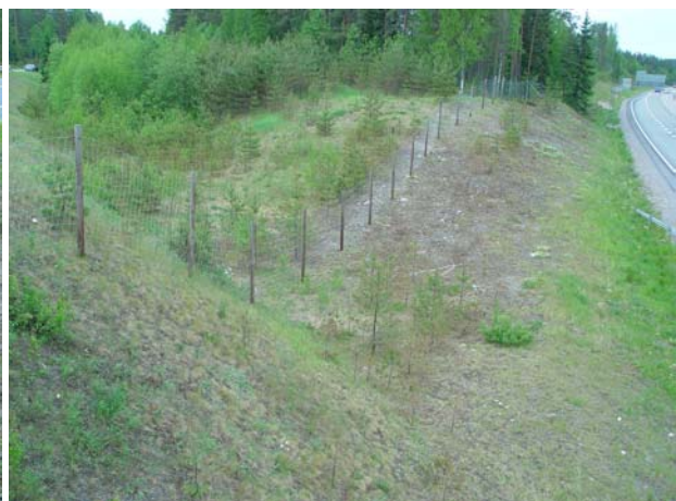
Kuvat 4 & 5. Pikkusiniivelle sopivia elinpaikkoja (kohteet 41 & 43). Molemmat kohteet sijaitsevat lähellä perhosen tunnettuja esiintymiä.