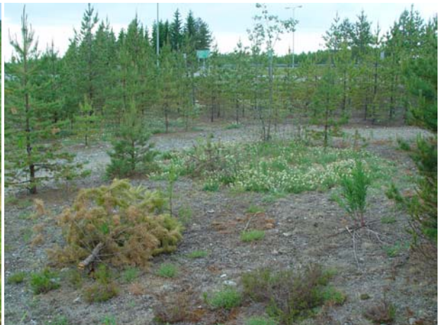
Kuvat 2 & 3. Pikkusiniivin elinpaikat kohteissa 33 ja 34. Molemmissa kohteissa umpeenkasvu vähentää paahteisuutta, ja mäntyntaimet alkavat jo varjostaa keulankärkikasvustoja heikentäen kohteiden laatua pikkusiniivin kannalta.