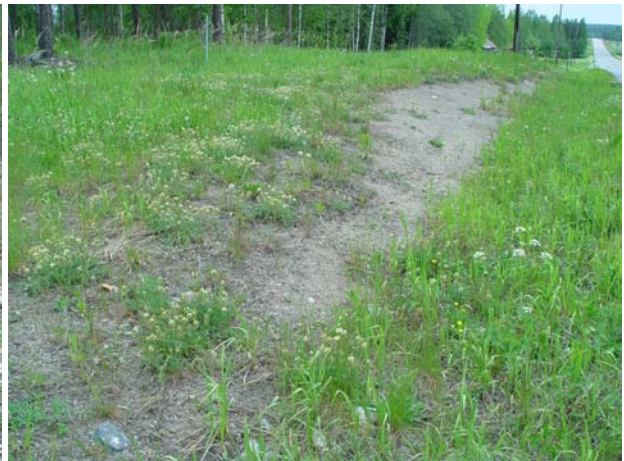
Kuvat 6 & 7. Lisää pikkusiniivelle sopivia elinpaikkoja tunnettujen esiintymien pohjoispuolella (kohteet 42 & 45). Molemmat kohteet kaipaavat hoitotoimia avoimuuden säilyttämiseksi.